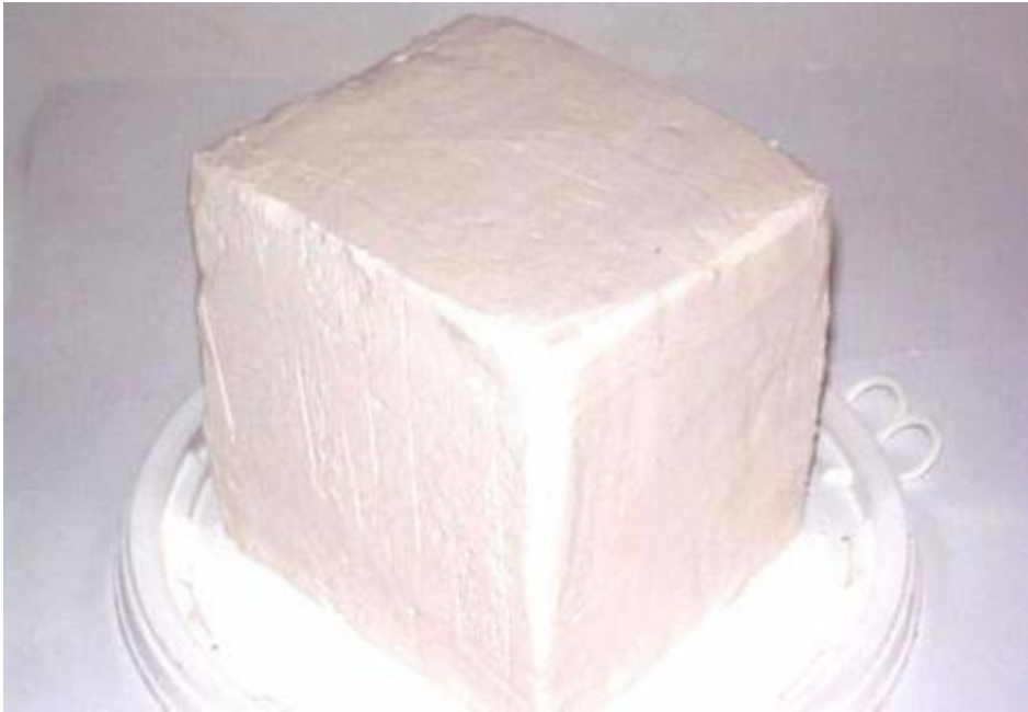
Gelkörper im System NaCl-MgCl 2 -H 2 O, mit Ca(OH) 2 als Bindemittel